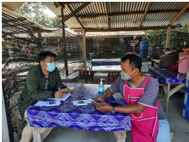
รูปที่ 3-1 (ต่อ) : ตัวอย่างบรรยากาศการสำรวจความคิดเห็น