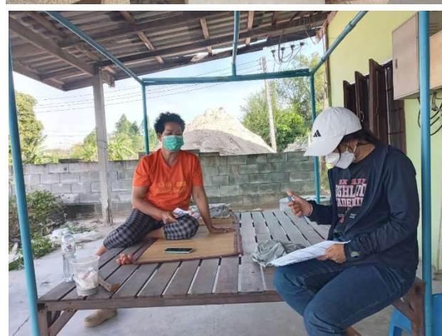
รูปที่ 3-1 : ตัวอย่างบรรยากาศการสำรวจความคิดเห็น